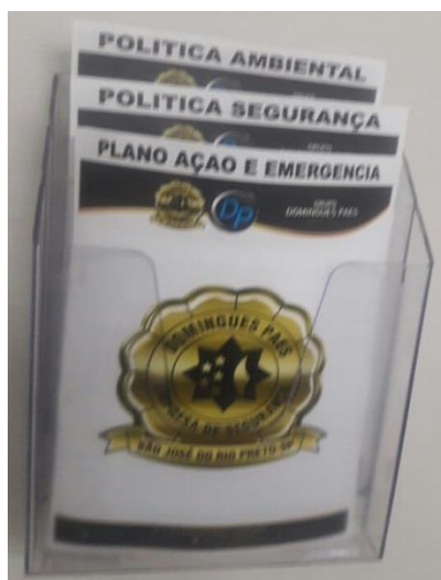
Política Ambiental e demais disponíveis na sede administrativa

Nosso compromisso com a promoção de um modelo de negócio baseado nos pilares da sustentabilidade foi formalizado a partir da elaboração e implantação de nossa Política Ambiental, que visa incentivar e nortear a introdução de práticas sustentáveis em nossas decisões, negócios e operações.